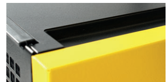
Twee uitsparingen in de bovenkap maken het mogelijk gelijke modellen ruimtebesparend te stapelen.